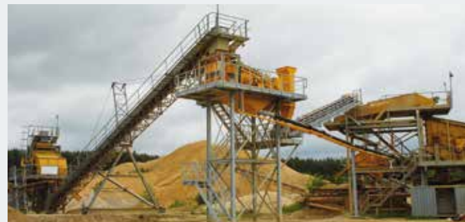
STICHWEH-Aufbereitungsanlage mit EINDECKSIEBMASCHINE VS 15/40 ZWEIDECKSIEBMASCHINE VS 24/60 DREIDECKSIEBMASCHINE VS 15/50 Doppelwellenschwertwäsche DSW 120/2100/6000 Entwässerungssieb Eb 09-25-1