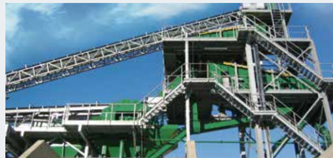
STICHWEH-Aufbereitungsanlage mit ZWEIDECKSIEBMASCHINE VS 18/50 ZWEIDECKSIEBMASCHINE VS 21/60 Schöpfrad E 4009 LA Entwässerungssieb Eb 12/35-03