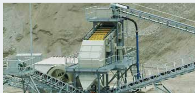
STICHWEH-Aufbereitungsanlage mit EINDECKSIEBMASCHINE VS 15/40 DREIDECKSIEBMASCHINE VS 18/60 Schöpfrad ES 3009 BB

ODER INFORMIEREN SIE SICH UNTER smt-stichweh.com