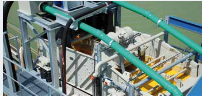
STICHWEH-ENTWÄSSERUNGSSIEBMASCHINE EB 18/35 mit 2 Siebbahnen und Zyklon