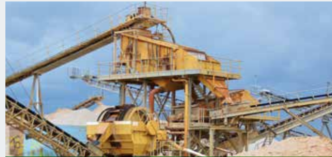
STICHWEH-Aufbereitungsanlage mit ZWEIDECKSIEBMASCHINE VS 24/60 Doppelwellenschwertwäsche DSW 150/2100/6000 Schöpfrad ES 3509 BB