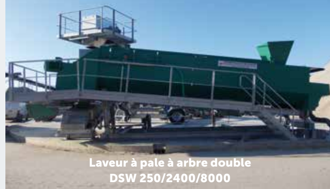
Laveur à pale à arbre double DSW 250/2400/8000